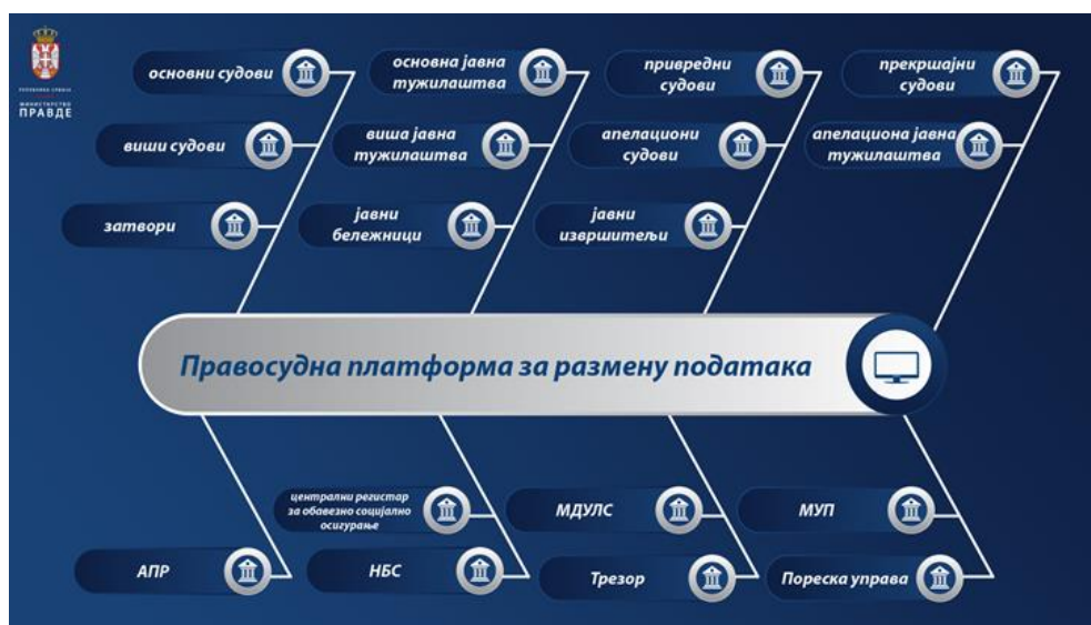
Слика 1. Скица система Enterprise Service Bus-a

Инфраструктурна платформа за интероперабилност представља систем који омогућава електронску размену података између различитих правосудних институција и државних органа ван система правосуђа. Правосудна платформа за размену података заснована је на Enterprise Service Bus који је вендорско решење компаније Мајкрософт ( Microsoft BizTalk Server ), док је Правосудни информациони систем портал за приступ корисника сету података за који су посебно овлашћени користећи наведени ЕСБ односно Правосудну платформу за размену података. (Слика 1.)